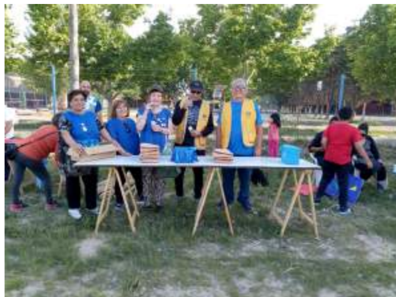
- Gómez – Barrio Nuevo - Quinta 25 - Malvinas - V. San Martin.

Dimos talleres en: Linea Sur - El Cuy - Cervantes – distintos Barrios de nuestra ciudad: Mosconi - La Rivera - Paso Córdoba - Stefenelli